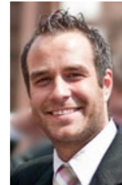
STEPHAN HEINICH BERATUNG & MARKETING

Sie haben noch Fragen zu den Kosten für die Intensivausbildung an der PIXL VISN media arts academy? Lassen Sie sich von uns unverbindlich beraten - auch zur möglichen BAföG-Förderung sowie zur Förderung durch die Agentur für Arbeit.